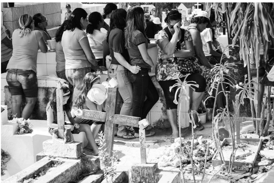
Figura 20 – Mulheres sentadas sobre sepulturas durante missa matinal