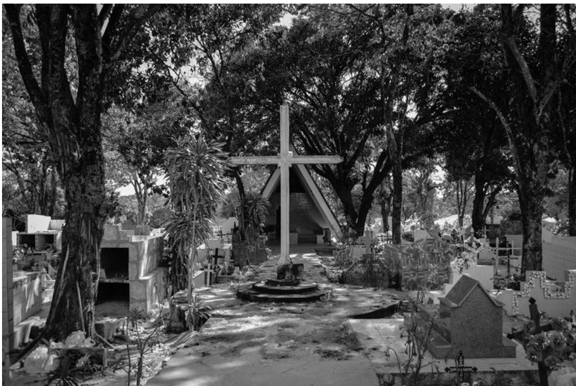
Figura 3 – Cruzeiro e, ao fundo, a capela cemiterial