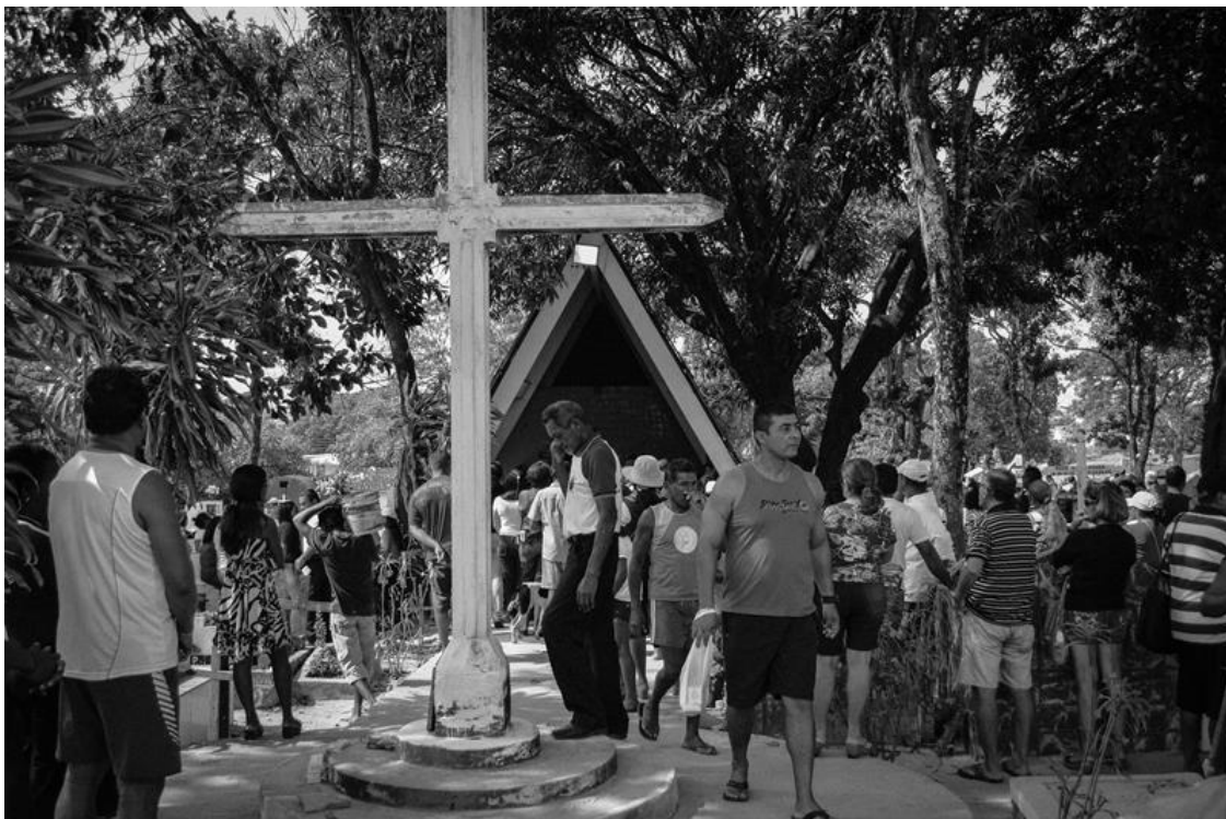
Figura 15 – Celebração da missa na manhã do Dia de Finados