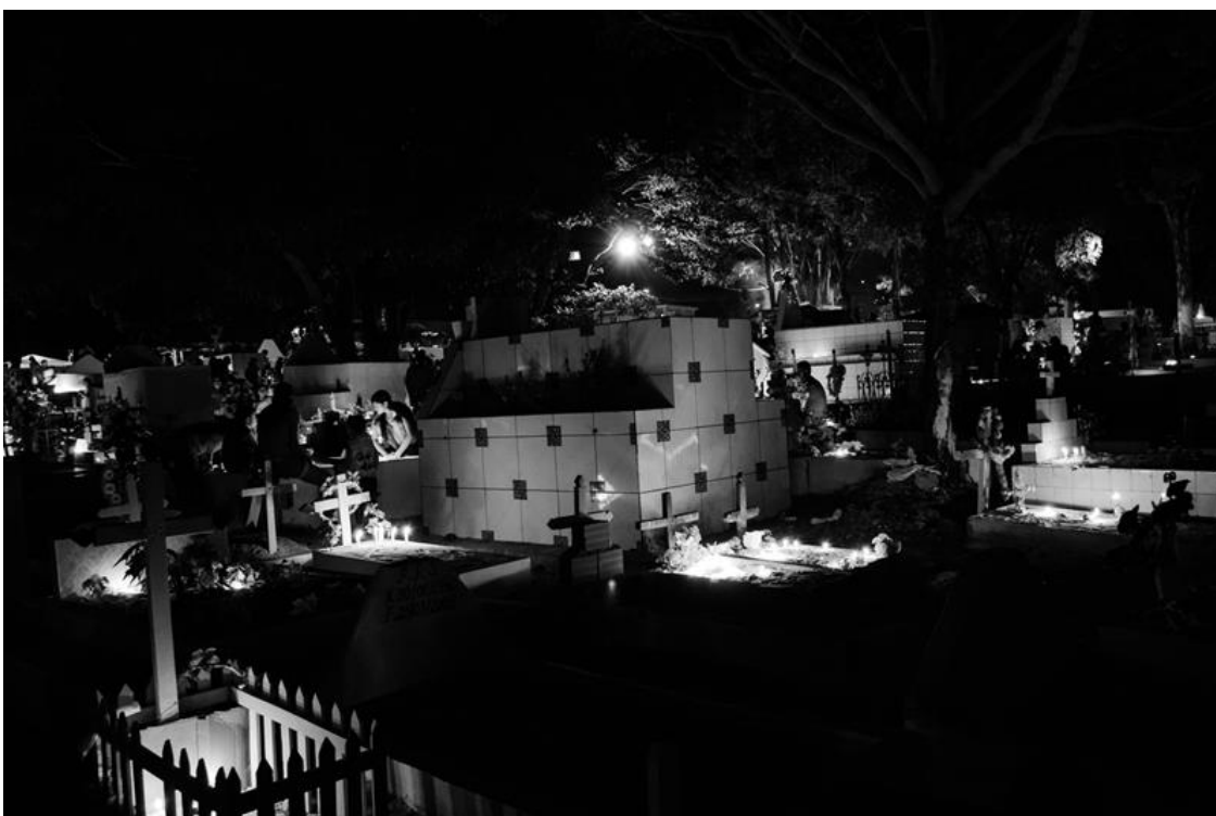
Figura 28 - Alguns túmulos iluminados ao final da noite