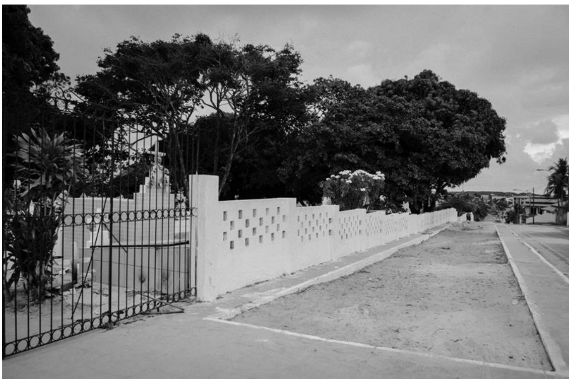
Figura 2 – Detalhe do portão e muro do cemitério