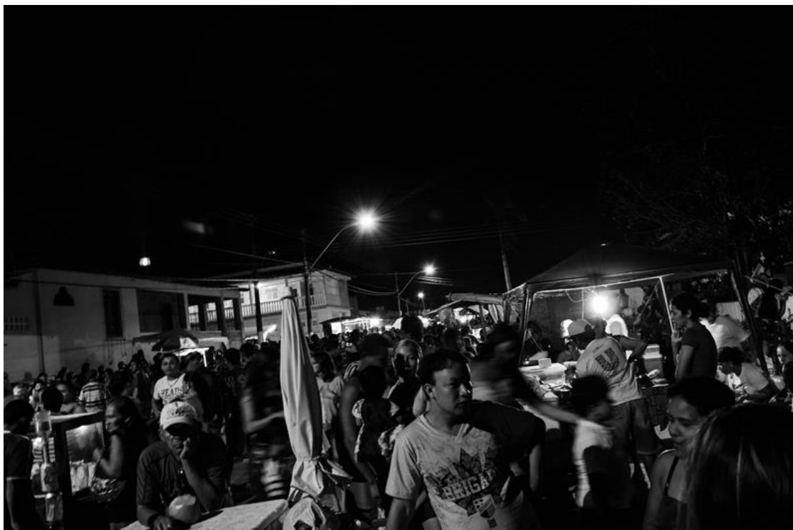
Figura 29 – Confraternização na frente do cemitério