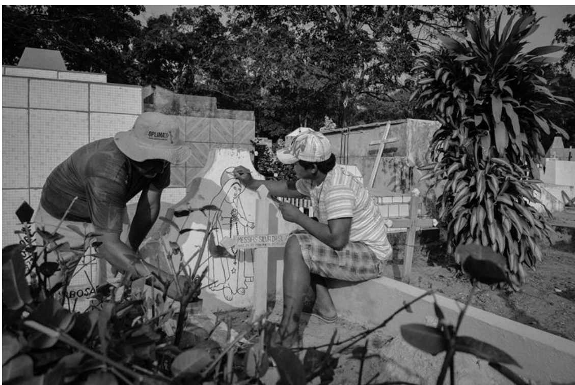
Figura 6 – Homens pintando uma sepultura