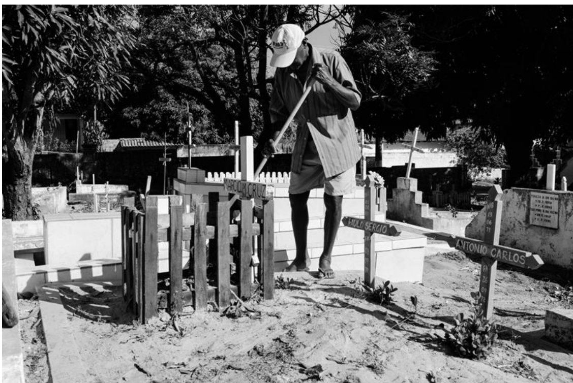
Figura 8 – Seu Paulo e a sepultura do ‘anjinho’