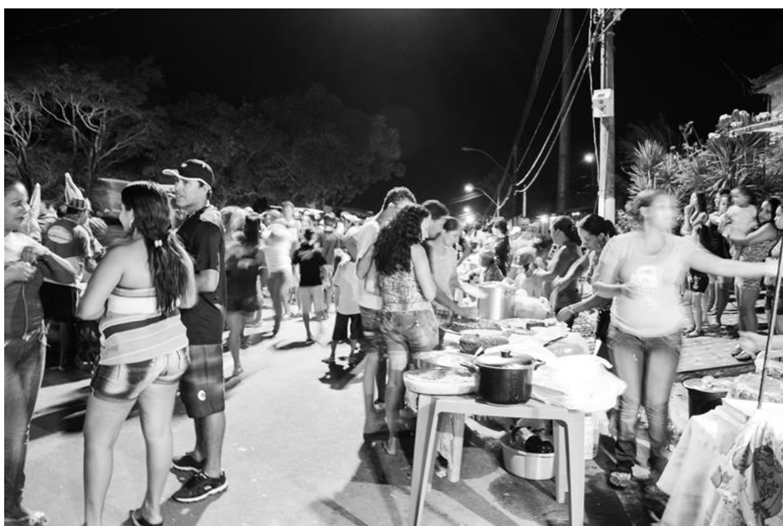
Figura 30 – Venda de comidas típicas do Pará durante confraternização