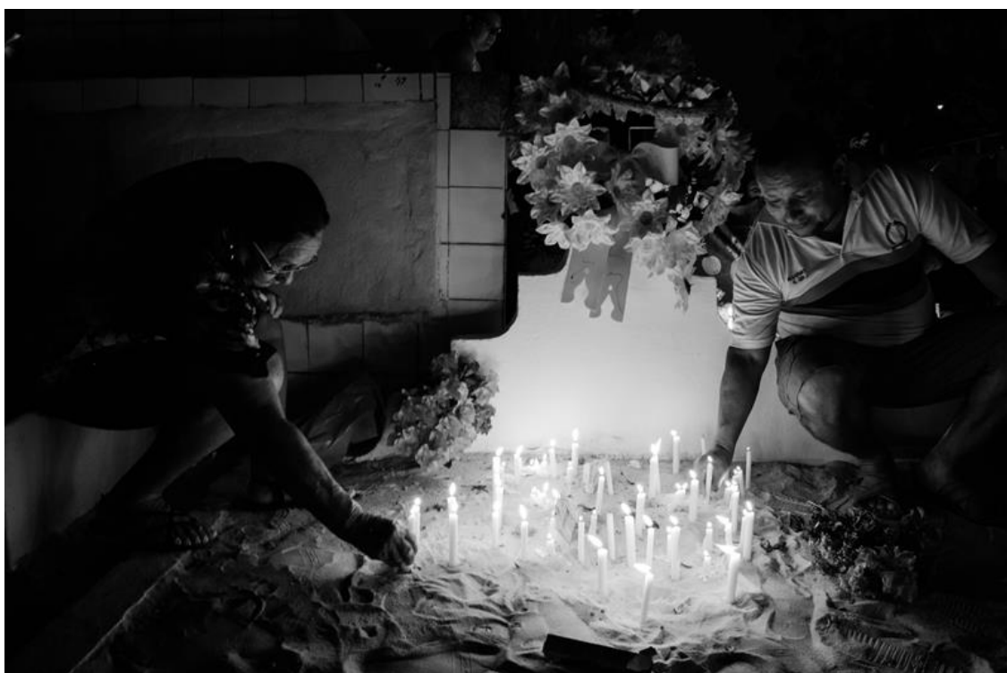
Figura 25 - Dona Ana (mãe) e Márcio (filho) iluminam familiares