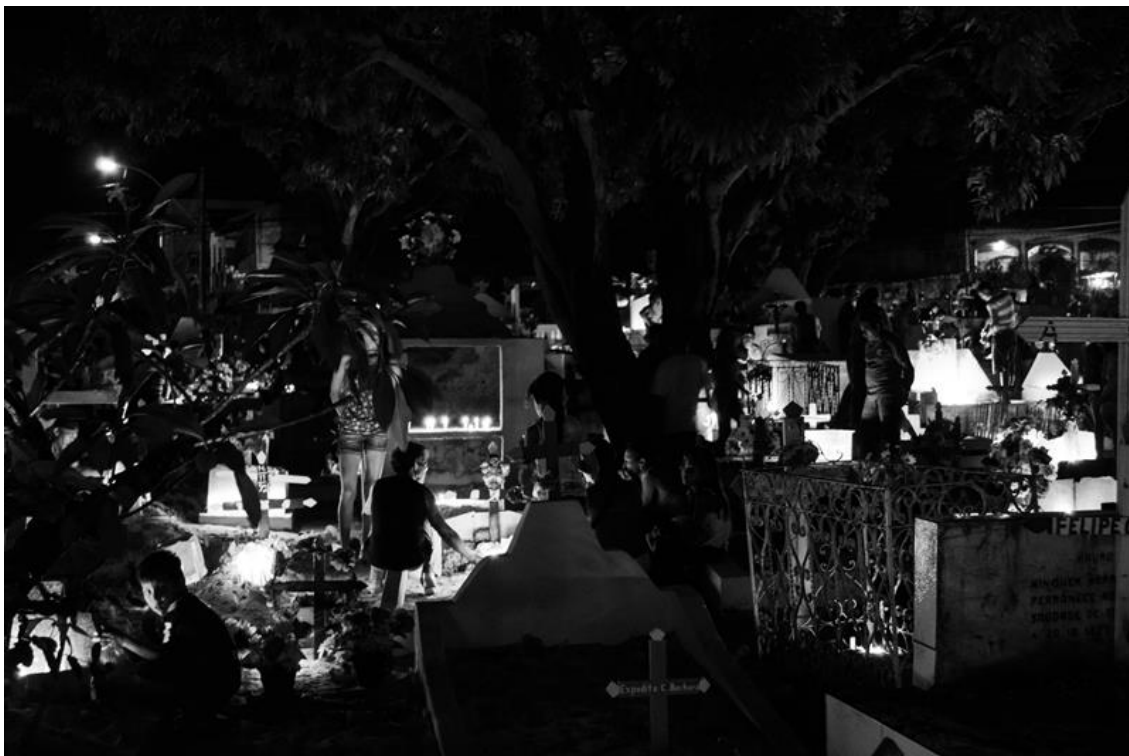
Figura 23 – Pessoas em torno dos túmulos na iluminação noturna