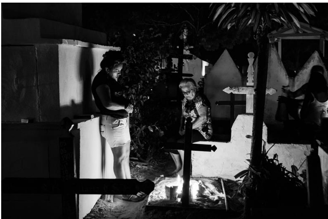
Figura 22 – Mãe e filha iluminam sepultura