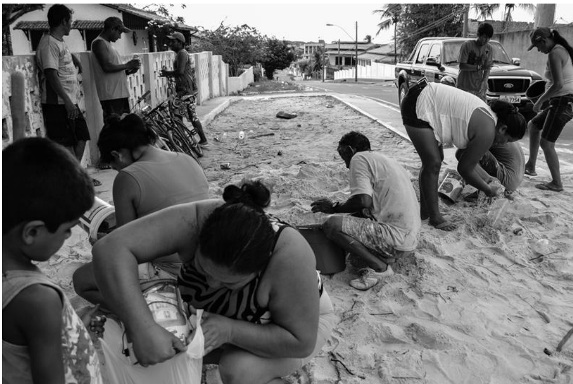
Figura 5 – Moradores recolhendo areia para a arrumação dos túmulos