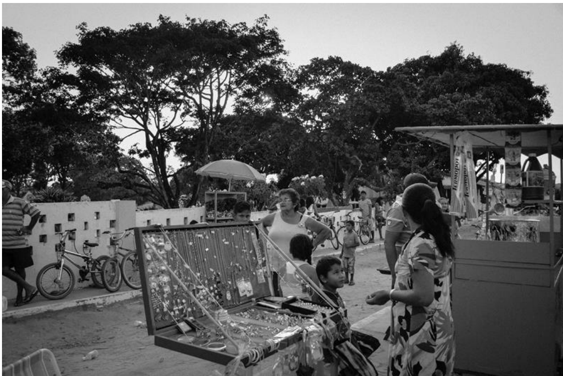
Figura 17 – Venda de bijouterias na frente do Cemitério do Bonfim