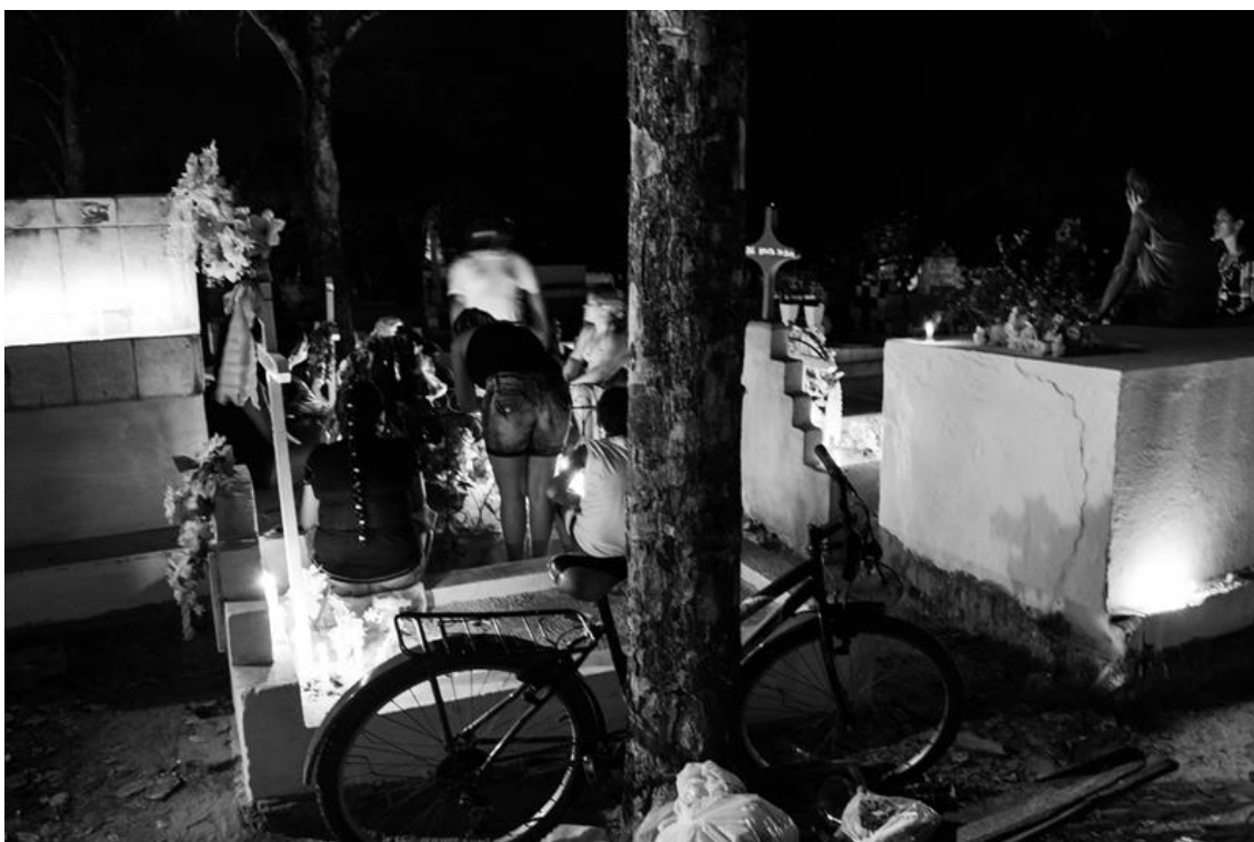
Figura 24 – Família iluminando um ente querido