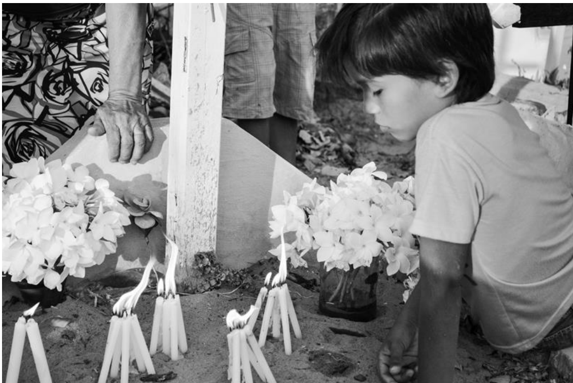
Figura 19 – Detalhe de velas agrupadas para resistir ao vento durante iluminação