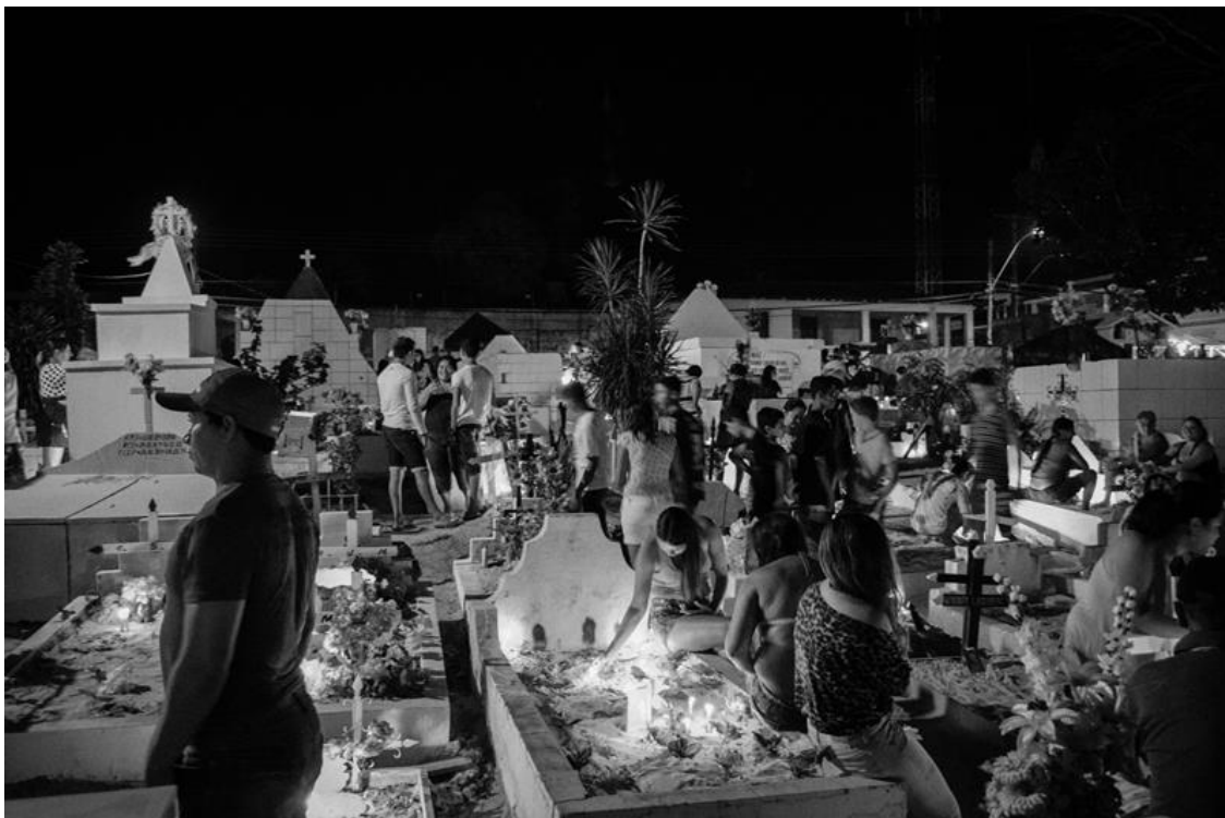
Figura 21 – Iluminação noturna dos mortos