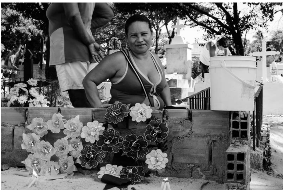
Figura 18 – Regina ilumina sepultura de seus pais pela manhã