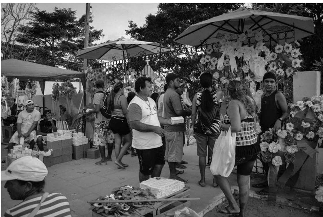
Figura 16 – Venda de adereços para as sepulturas e velas para a iluminação