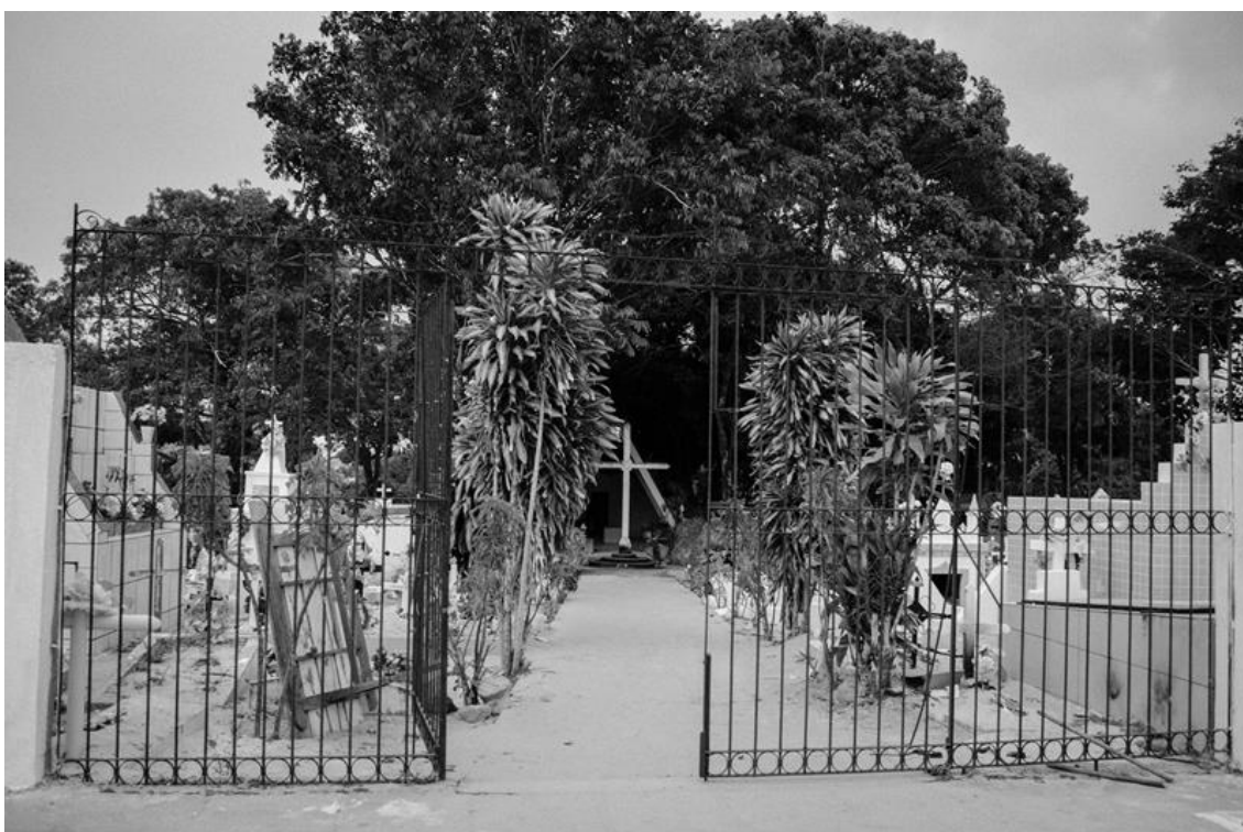
Figura 1 – Portão principal do Cemitério do Bonfim